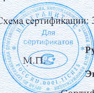
Схема сертификации: 3.